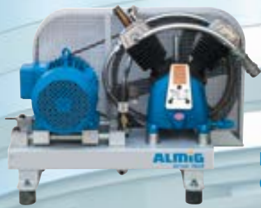
Booster auf Grundplatte