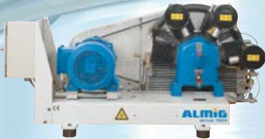
HL auf Grundplatte