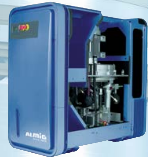
HP, im standardmäßigen Schalldämmgehäuse