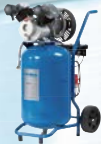
AT 6002 AT 7002