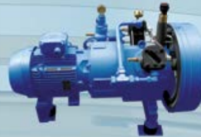
Booster auf Schwingelementen