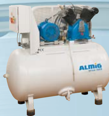
HL auf Behälter