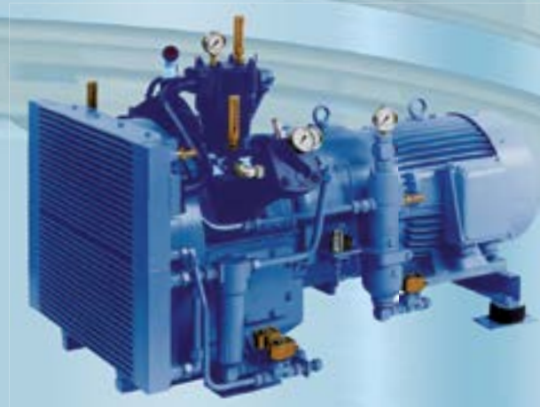
HLD auf Schwingmetallagerung

Die Baureihen bieten durch ihr durchdachtes Baukastenprinzip alle Möglichkeiten des Einsatzes, selbst unter schwersten Industriebedingungen bis zu 40 bar.